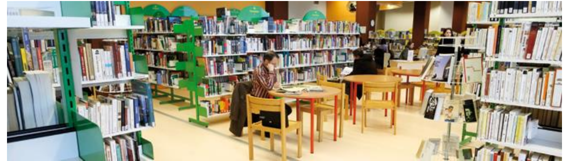
Médiathèque de Croix-de-Neyrat, Clermont-Ferrand