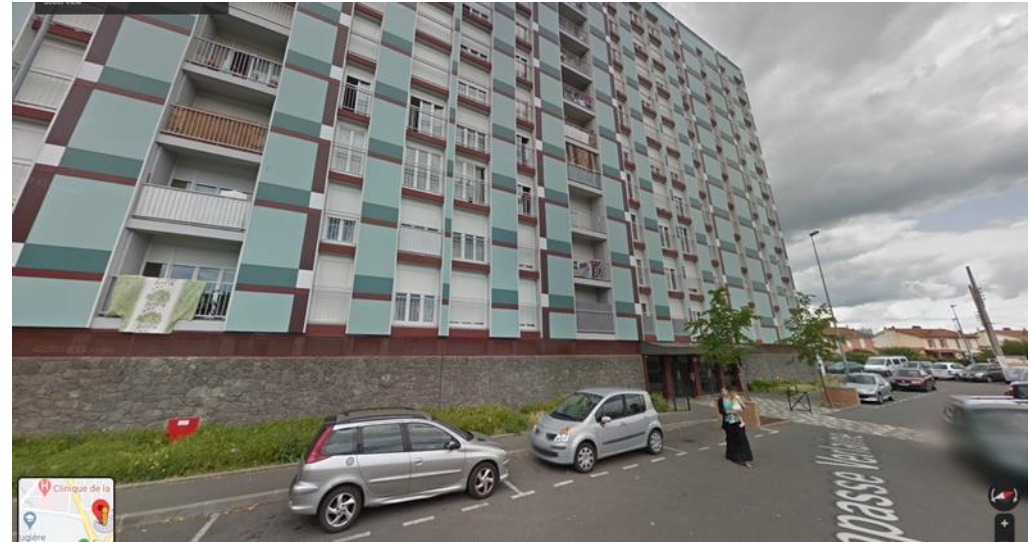
Bâtiment 31, impasse Verlaine. Clermont Ferrand 2019